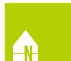
TAVOLA Mix LISTONE PREFINITO A 2 STRATI CONTROBILANCIATURA IN MULTISTRATO DI BETULLA